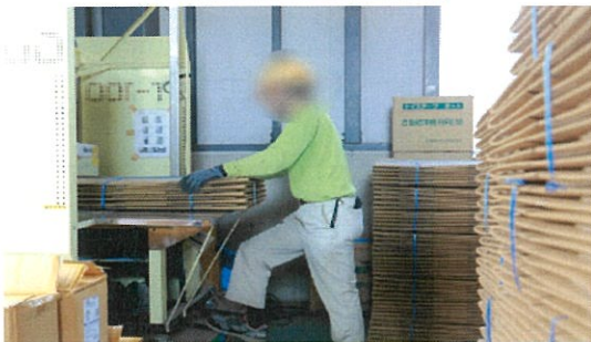
医療ダンボール結束