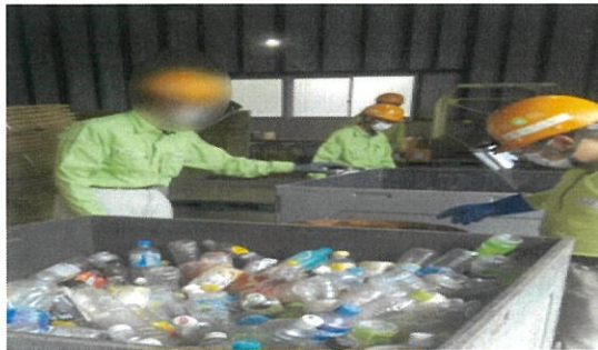
ペットボトル水抜き