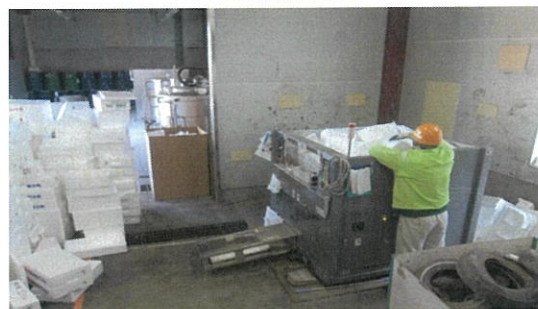
発泡スチロール溶融