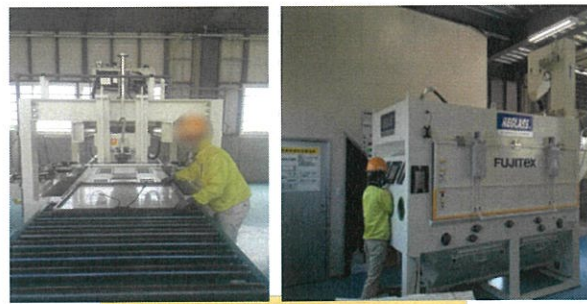
太陽光パネルリサイクル