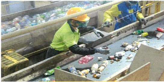
産業廃棄物の選別