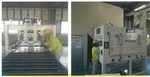
(構内作業) 太陽光パネルリサイクル