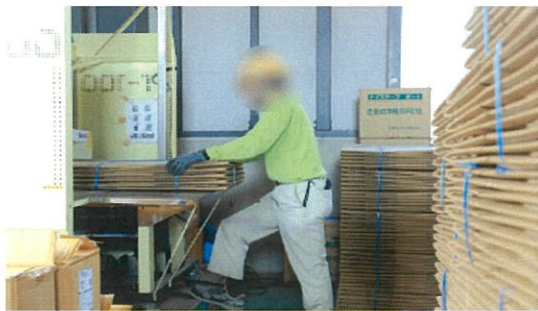
医療ダンボール結束