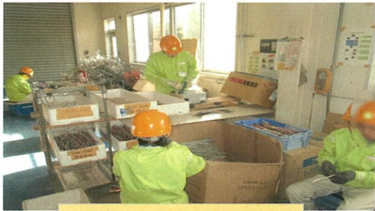
(構内作業) 被覆剥ぎ