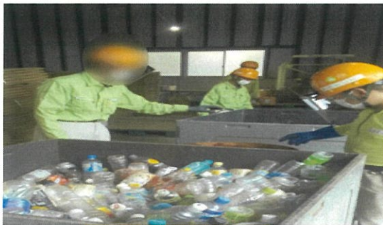
ペットボトル水抜き