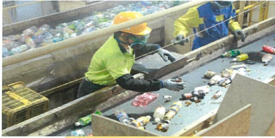
産業廃棄物の選別