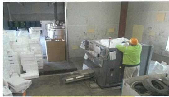
発泡スチロール溶融